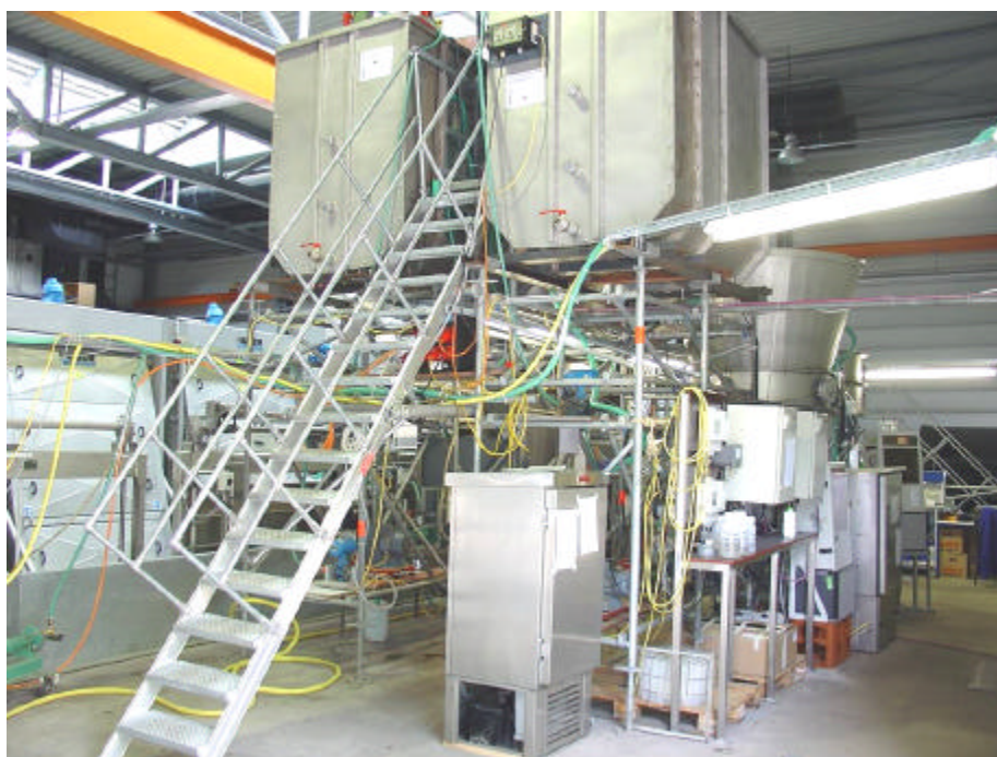
Bild 1: Versuchsanlage auf dem Gelände des ZVK Steinhäule, Neu-Ulm

Ziel des Vorhabens ist es, durch Entnahme von partikulären und gelösten Stoffen im Kläranlagenablauf eine dauerhafte Unterschreitung der CSB-Werte von 20 mg/l sicherzustellen. Gleichzeitig wird die Möglichkeit untersucht, ob und in welchem Umfang organische Mikroschadstoffe, zu denen u.a. Rückstände von Arzneimitteln und endokrin wirksame Substanzen zählen, aus dem Ablauf entnommen werden können, um ihren Eintrag in die aquatische Umwelt zu verringern.