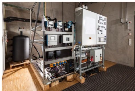
Bild 2: Laborkälteanlage zur Untersuchung von verbesserten Betriebsstrategien

Das zu entwickelnde Service- und Diagnosewerkzeug muss in die Arbeits- und Geschäftsprozesse von Serviceanbietern und Betreibern integriert werden, um in der Praxis angenommen zu werden. Die Ergebnisse der automatisierten Fehlererkennung und Diagnose müssen entsprechende Servicetätigkeiten und Optimierungsmaßnahmen auslösen und durchgeführte Maßnahmen müssen dokumentiert werden. Hierfür wird ein Workflow für optimierte Serviceeinsätze erarbeitet sowie Konzepte für vertragliche Vereinbarungen mit den Kunden.