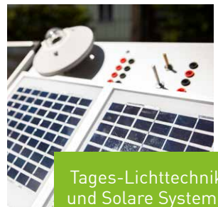
Tages-Lichttechnik und Solare Systeme

Kältetechnik, Hydraulik und Technikum Gebäudeklimatik