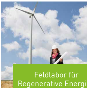
Feldlabor für Regenerative Energien

Detaillierte Informationen zu den Laboreinrichtungen des IGE gibt es unter: